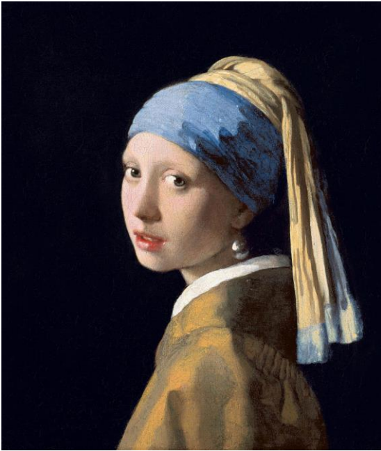
《戴珍珠耳環的少女》，創作於 1665 年，現藏於荷蘭海牙莫瑞泰斯皇家美術館。