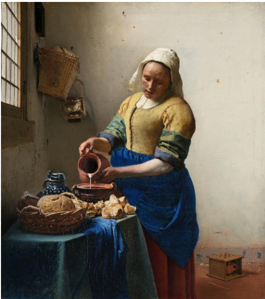
《倒牛奶的女僕》，創作於 1658-1660 年間，現藏於荷蘭阿姆斯特丹國家博物館。