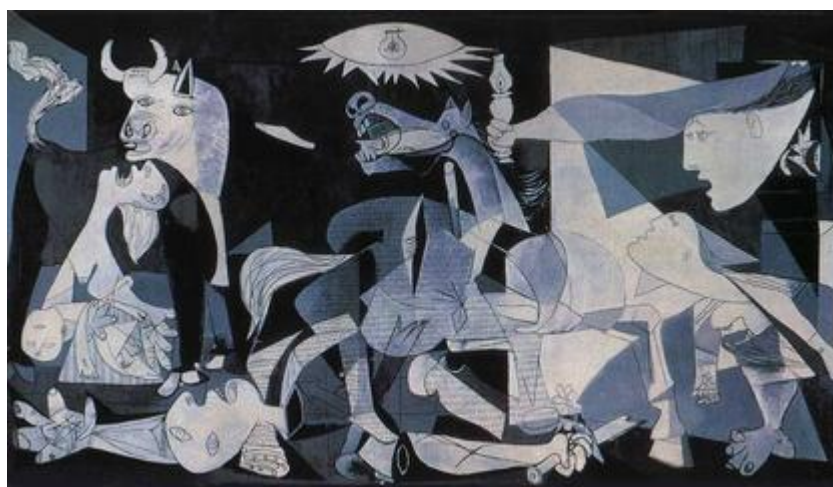
《格爾尼卡》，創作於 1937 年， 現藏於西班牙索菲亞王后博物館