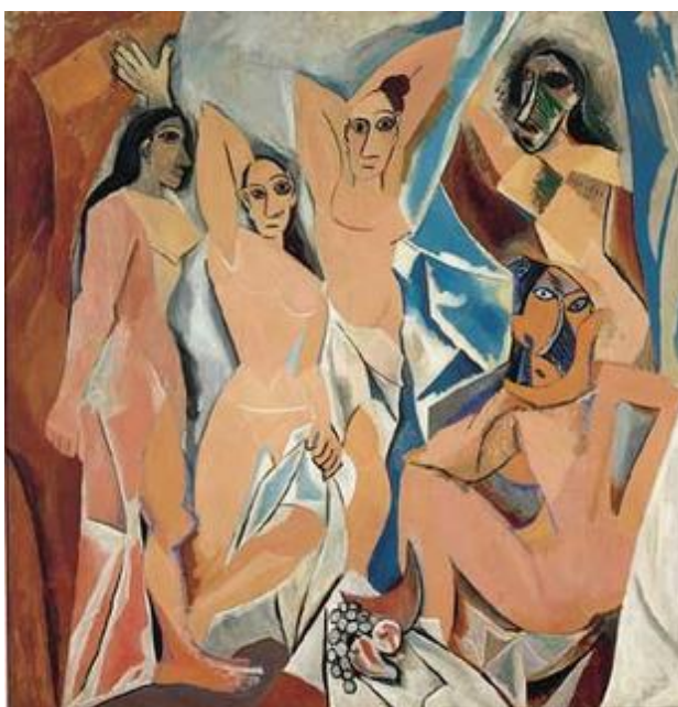
《亞維農少女》，創作於 1907 年， 現藏於紐約現代藝術博物館