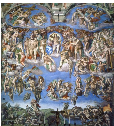
壁畫《最後的審判》(局部)，創作於 1538 至 1541 年間，現藏於梵蒂岡博物館