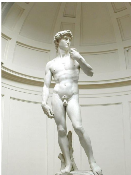
《大衛像》，創作於 1501 至 1504 年間，現藏於佛羅倫斯學院美術館