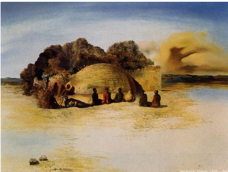
《偏執狂之臉》，創作於 1937 年