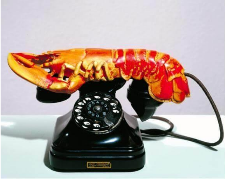
雕塑作品《龍蝦電話》，創作於 1936 年，現藏於蘇格蘭國家美術館。