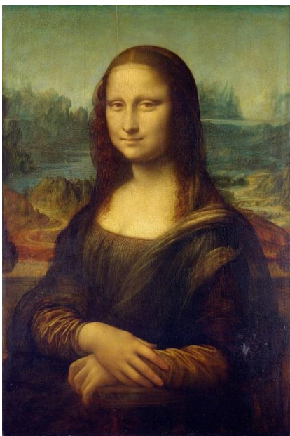
《蒙娜麗莎》(Mona Lisa)，創作於 1503-1505 年間，現藏於盧浮宮