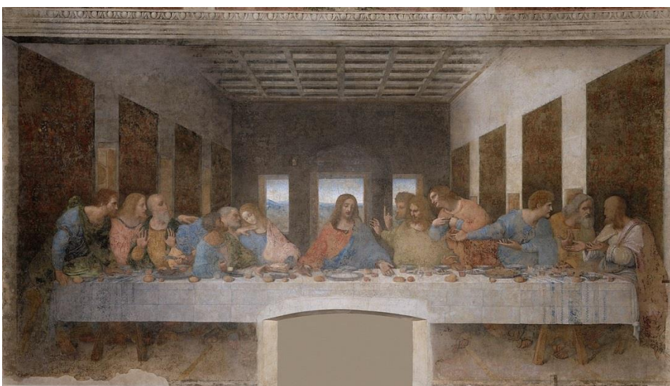
《最後的晚餐》(The Last Supper)，創作於 1498 年，現藏於米蘭恩寵聖母