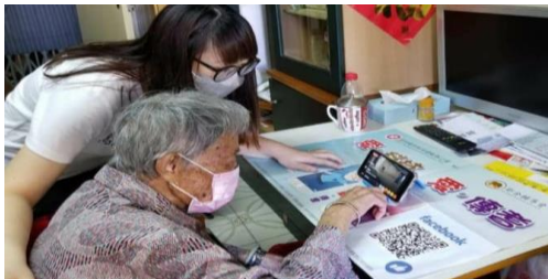
職員協助體弱長者參與直播活動。

鄰舍輔導會獲政府資訊科技總監辦公室資助推行「愛·科技 愛·傳耆」計劃，致力推廣長者學習使用資訊科技，將數碼科技融入生活。計劃通過Facebook專頁的直播活動「傳耆直播之社區暢遊」(簡稱「社區暢遊」)，鼓勵長者運用資訊科技產品與社會保持聯繫。在疫情期間，長者減少外出，留在家中，難免會感到鬱悶。計劃以直播形式代替長者出外遊走不同景點，讓長者在疫情期間，不用外出也可以看看不同的地方，舒暢心靈。