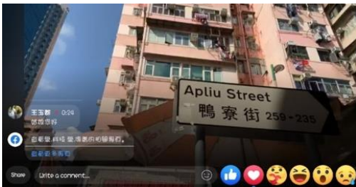
社區暢遊：深水埗鴨寮街。