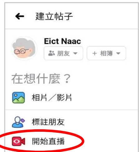
按此開始進行直播。

每個Facebook帳戶只需要一部智能手機及連接互聯網就可以進行直播。在Facebook「在想什麼」下面選擇「開始直播」。